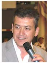
Président de la Ligue Dauphiné Savoie Vivarais