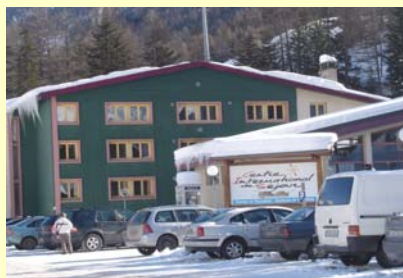
Le Centre de Séjour de Val Cenis qui accueillera les compétiteurs