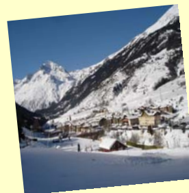
Val Cenis — site ski alpin