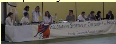
Les juges de Twirling en grande discussion

Le 1 er mars à Dièmoz s'est déroulé la compétition régionale individuelle ainsi que le challenge en équipe. Une centaine de Twirlers des clubs de et Dièmoz ont concourus dans différentes catégories afin notamment de se qualifier pour le Championnat national individuel qui se déroulera les 11 & 12 avril à La Verpillière, Yenne, Beaurepaire et Challans.