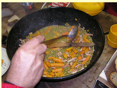
Les repas préparé avec soin par Mado et Théo !

Une consigne « Plus tu roules vite plus c'est stable ! »