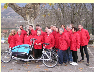
Une équipe de 22 Givrés se sont retrouvés le mercredi 25/11 pour rejoindre Marseille