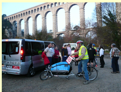
Acqueduc de Roquefavour

22 clubs qui ont accueillis et préparés des repas chaud.