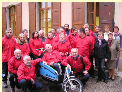
Souvenir de notre arrêt à St Laurent du Pont,