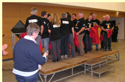
Notre prochain Défi participé au Paris—Rome en 2011 pour les 100 ans de la F.I.C.E.P organisé par la F.S.C.F.